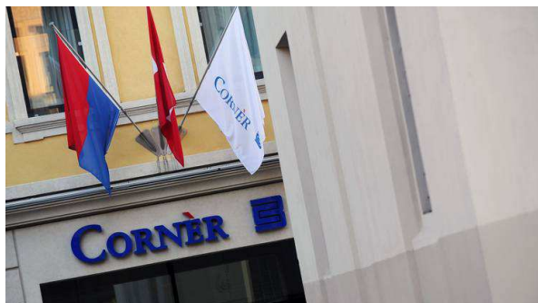
La sede luganese della Cornèr Banca