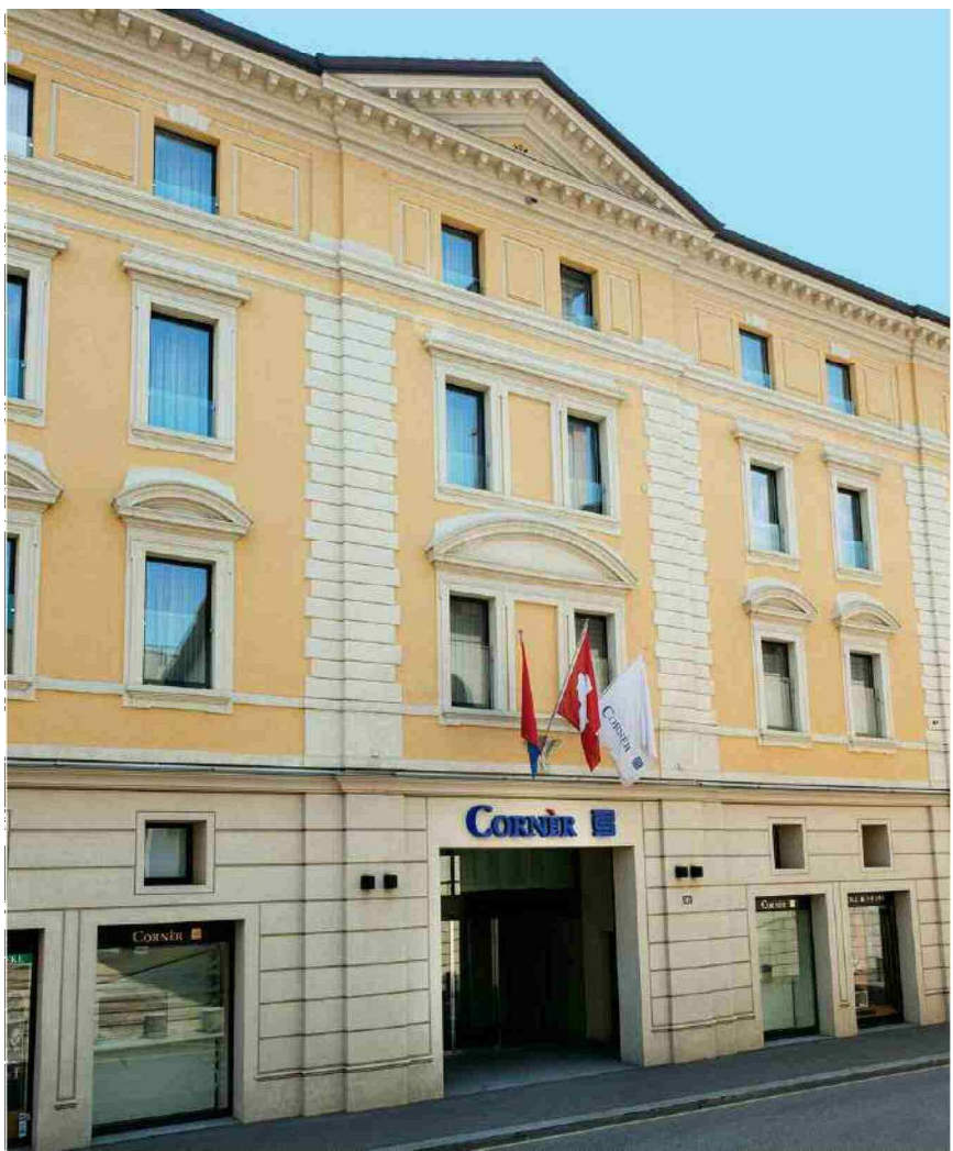
Il gruppo sul piano globale impiega 1'199 persone a tempo pieno

Tema n°: 220.026 Abbonamento n°: 220026 Pagina: 7 Superficie: 44'218 mm²